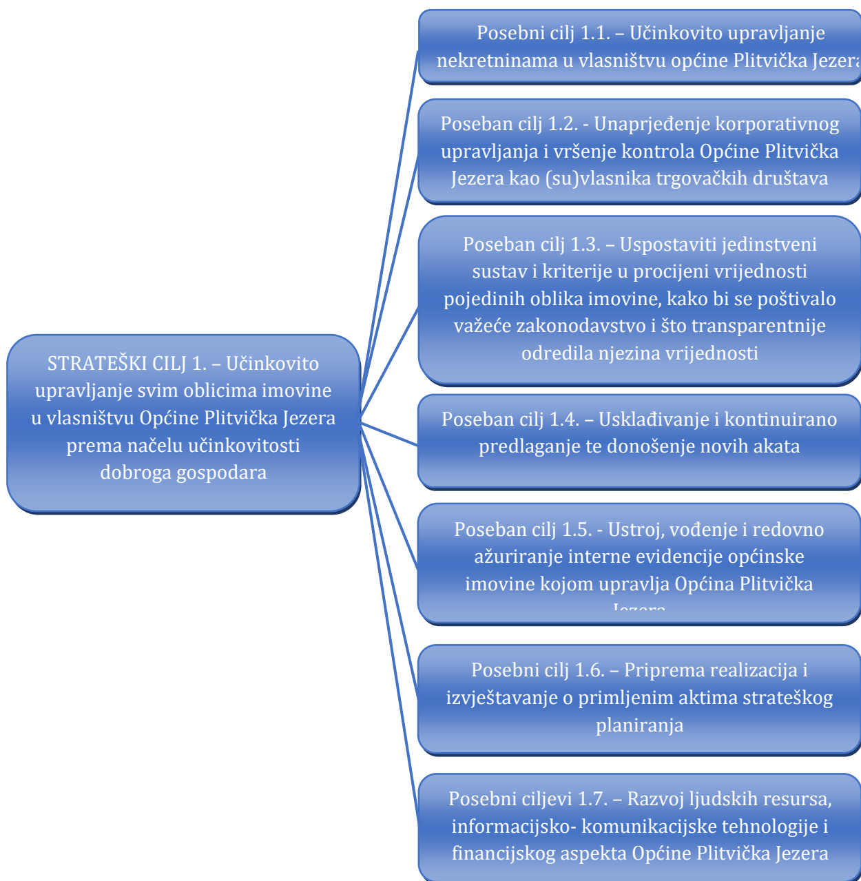
Slika 2. Kaskadiranje strateškog cilja upravljanja općinskom imovinom