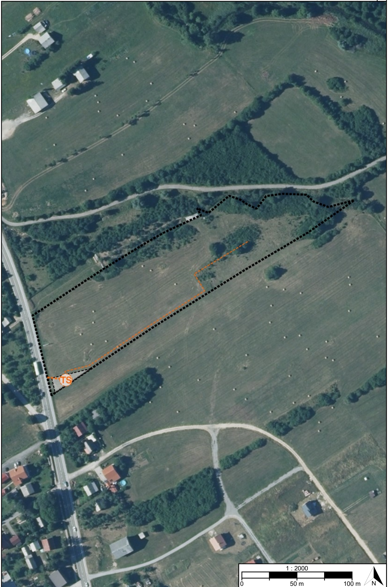
Postupak transformacije Urbanistički plan uređenja dijela naselja Korenica-sjever