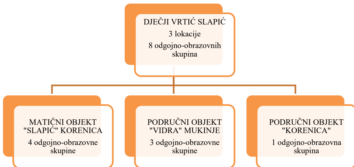
Grafički prikaz 1: struktura vrtića

U pedagoškoj godini 2024./2025. Dječji vrtić Slapić realizirao je programe na 3 objekta u 8 odgojno-obrazovnih skupina redovnog programa.